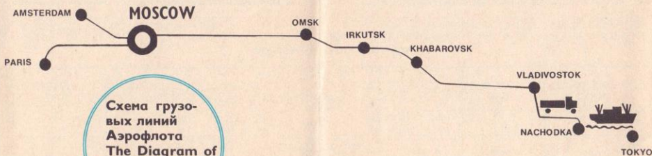
Схема грузовых линий Аэрофлота The Diagram of Aeroflot Cargo Routes

От Владивостока груз транспортируется автотранспортом и паромом через Находку в Йокогаму.