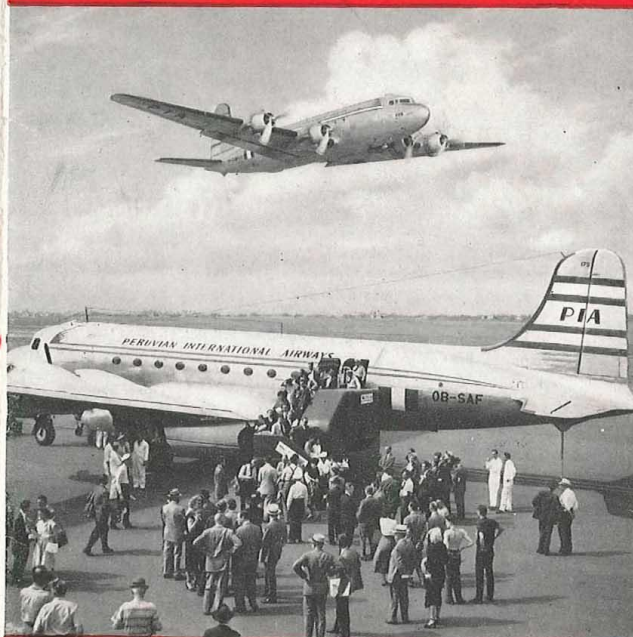
EL PRIMER VUELO OFICIAL ATERRIZA EN EL AEROPUERTO INTERNACIONAL DE NUEVA YORK