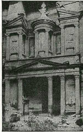
بيت المال — بيترا The Treasury, Petra